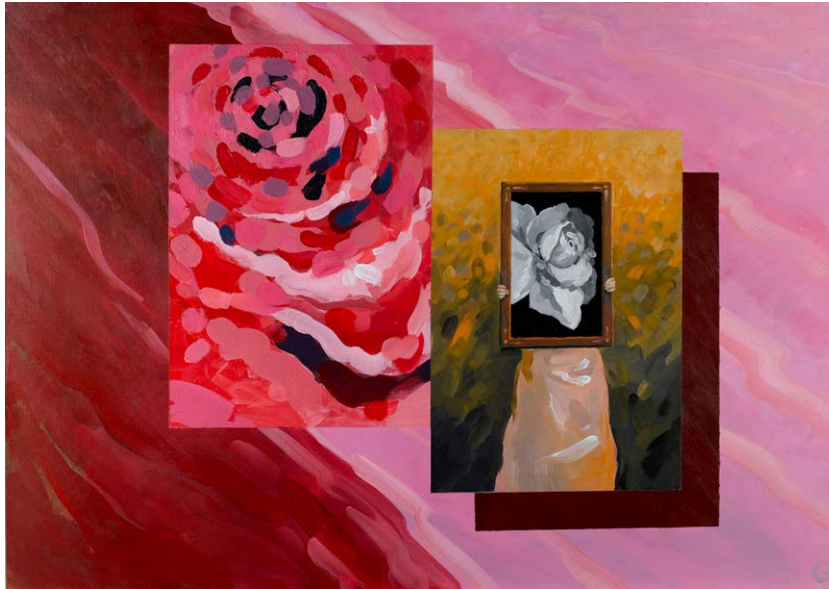
"maintaining silence" acrylics on canvas 100cm x 70cm