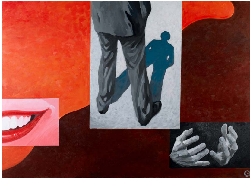
"facing silence" acrylics on canvas 100cm x 70cm