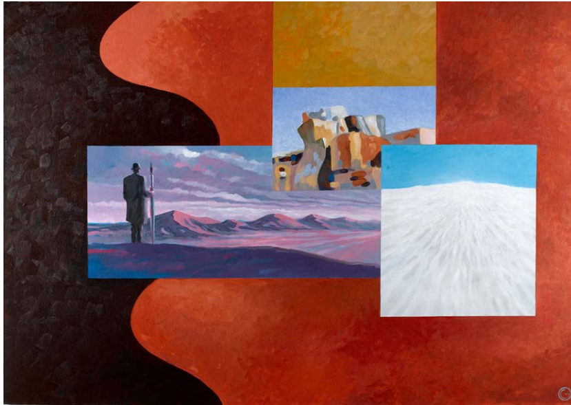
"hoping silence" acrylics on canvas 100cm x 70cm