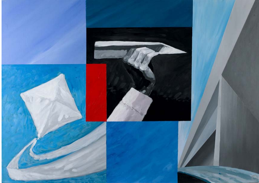
"vibrating silence" acrylics on canvas 100cm x 70cm