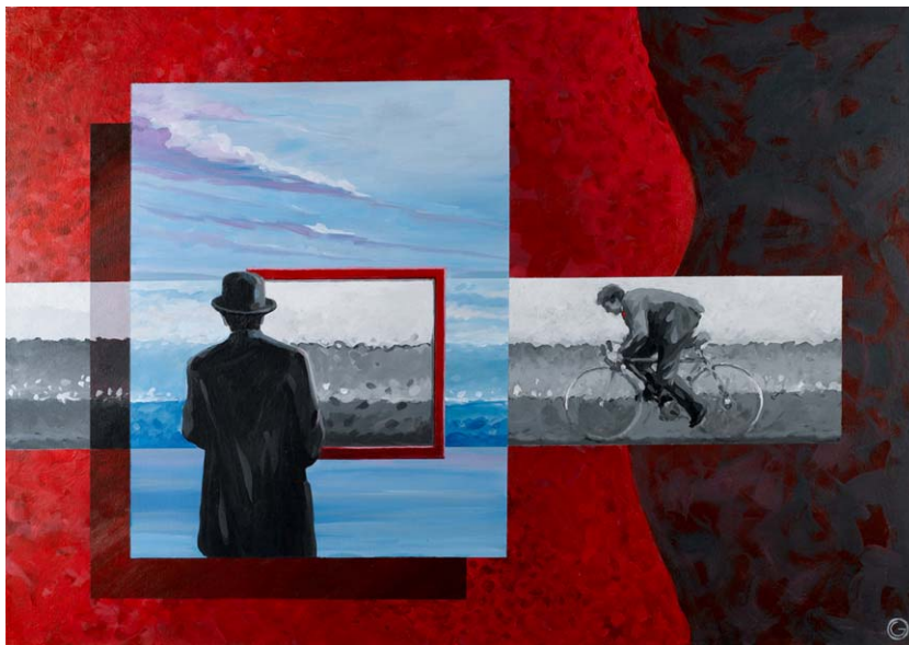
"waiting silence" acrylics on canvas 100cm x 70cm