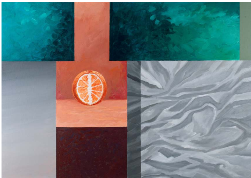
"orienting silence" acrylics on canvas 100cm x 70cm