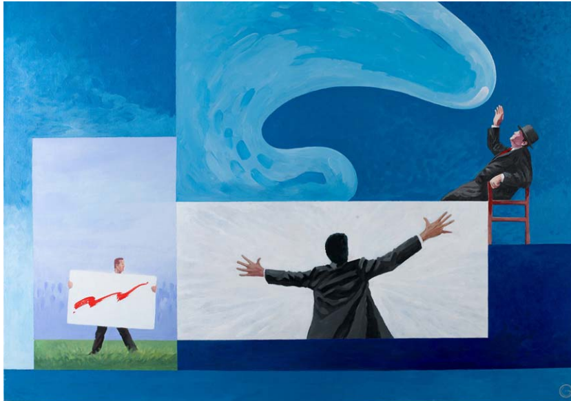
"shouting silence" acrylics on canvas 100cm x 70cm