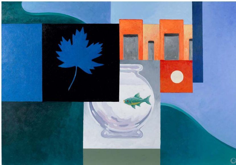
"floating silence" acrylics on canvas 100cm x 70cm