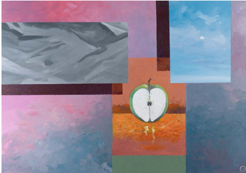
"questing silence" acrylics on canvas 100cm x 70cm