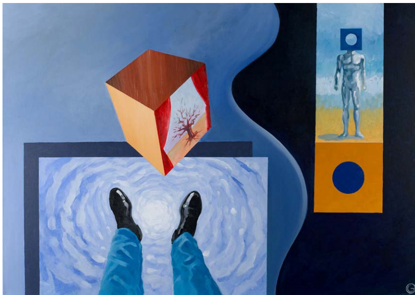
"going silence" acrylics on canvas 100cm x 70cm