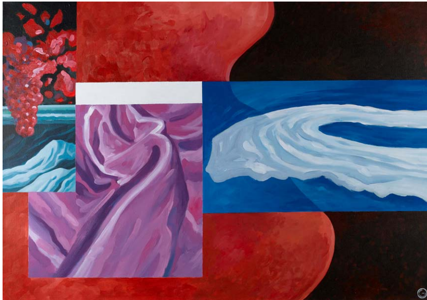
"getting silence" acrylics on canvas 100cm x 70cm